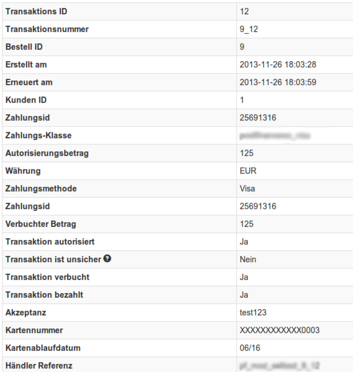
Abbildung 8.1: Transaktionsinformationen.