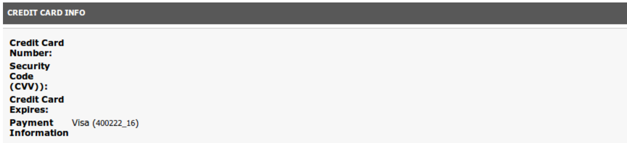
Abbildung 8.1: Transaktionsinformationen

In der Folge finden Sie eine Übersicht über die wichtigsten Funktionen im täglichen Gebrauch des BNP Paribas Mercanet Moduls.