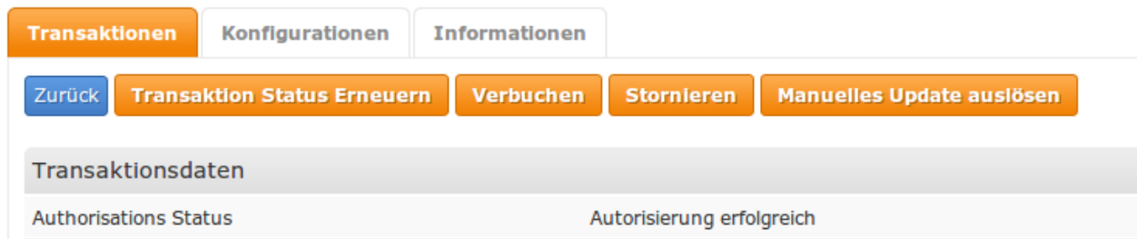
Abbildung 6.1: Stornieren von Bestellungen im JTL Backend