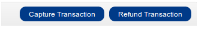
Abbildung 7.1: Capture oder Cancel in OpenCart.